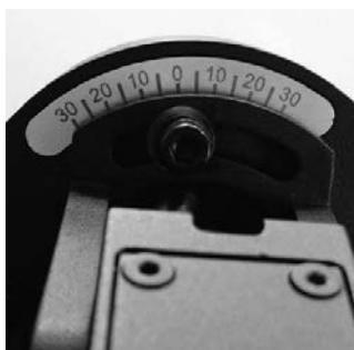
orientable horizontable 60°