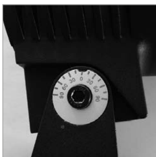
orientable verticale 180°